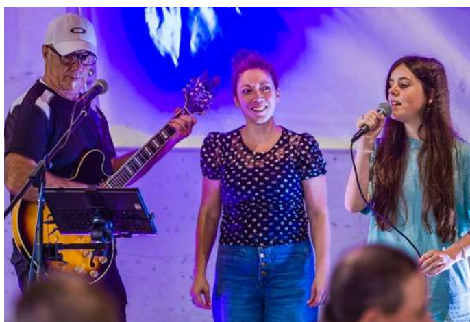
Fête du village - 12 août - Corporation du Pays de l'Ardoise 2023