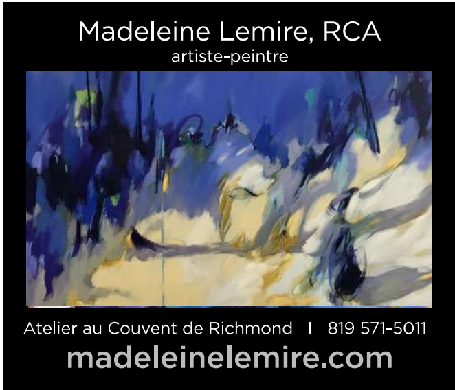
Richmond - Quartier anglais

Toute l'équipe du journal vous souhaite une rentrée en couleurs !