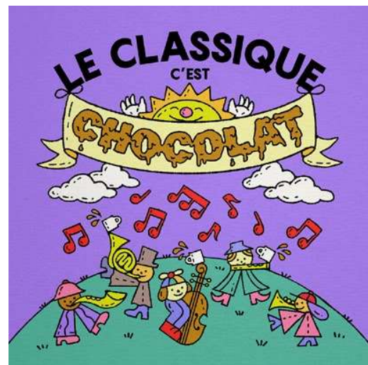
Musique classique et chocolat chaud pour petits et grands