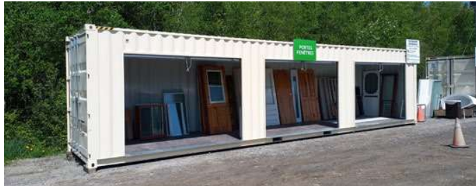
Espace de récupération de l'Écocentre du Val-Saint-François

construction, meubles ou jouets encore bons, ils peuvent être déposés dans la tente ou les conteneurs du réemploi pour être redonnés gratuitement à d'autres citoyens ! Avant de vous déplacer, n'oubliez pas de séparer vos matières pour faciliter le déchargement et optimiser la valorisation. Pour connaître les matériaux acceptés, les conditions et les heures d'ouverture, consultez-le : https://val-saint-francois.qc.ca/services/ecocentres/ .